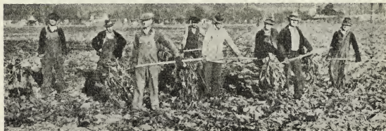
Arbeiders werken aan het Voorzorgplan.