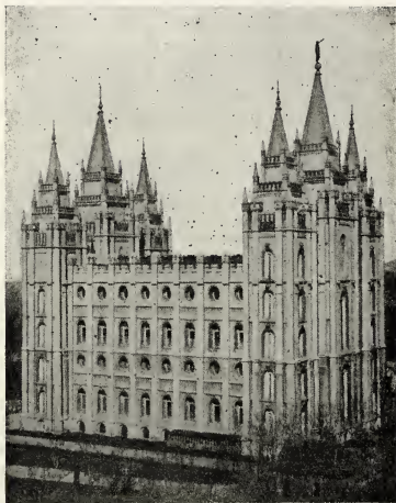
De Tempel te Salt Lake City