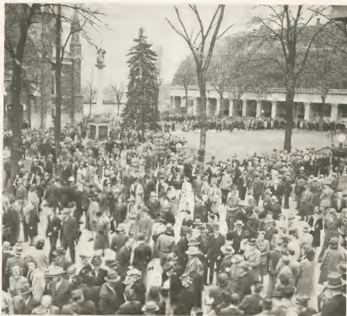
APRIL - CONFERENTIE TE SALT LAKE CITY.