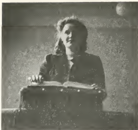
De zendelinge spreekt.

kocht,” en wij behooren onszelven niet toe, wij behooren den Meester toe. Wij zijn vrij van alle erfzonde, want het bloed van Christus heeft haar onvoorwaardelijk afgewasschen van de ziel van ieder levend schepsel. Maar terwijl wij in de wereld zijn, zijn wij geneigd zonde te doen. Wij hebben onzen vrijen wil, en wij mogen kiezen. Het goede is te eener zijde, het kwade te anderder. De vrije keus is fundamenteel. Vaak kiezen wij het kwade en zonde. Heeft Christus ook deze persoonlijke zondeschuld voldaan? Ja, maar de gevolgen van Zijn verzoening vallen ons alleen op zekere voorwaarden ten deel. Hier krijgen wij onze beurt. Hier moeten wij handelend optreden. En verder, hier komt de eeuwige wet der vergelding uit.” Op dit moment werd er geklopt. De vrouw des huizes wilde de kamer doen, maar Harald vroeg haar het wat uit te stellen. Toen zij heengegaan was, wendde hij zich opnieuw tot den spreker en zeide: „Ga door, asjeblieft.” „Zooals ik zeide, heeft Christus ons gekocht en hooren wij Hem toe. Hij heeft dus ontegenzegge-