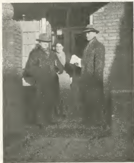
Zendingen aan den arbeid.

„Christus is dus het uitgangspunt, In Hem woont alle volheid. Hij heeft vrede gemaakt door het bloed Zijns kruises, en heeft alle dingen verzoend tot zichzelf. Dat is de reden waarom Christus de achtergrond van dit alles is. Welnu, zonde en kwaad zijn in de wereld en het is een voortdurende strijd van onze zijde om uit haar strikken te blijven. Waarom de zonde in de wereld is, kunnen wij nu niet breedvoerig bespreken — ze is er, dat