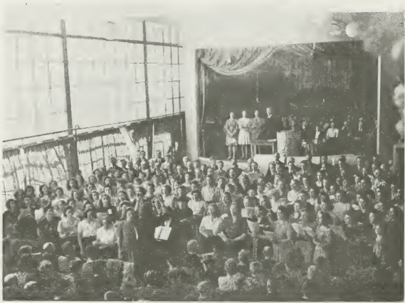
De Verenigde Koren.

dus een andere weg gezocht worden. We wisten, dat de Rotterdamse leden ons niet in de steek zouden laten, en daarom werd een beroep op hen gedaan, waaraan spontaan gehoor werd gegeven; tijdens de conferentiedagen nam iedereen, die een bed of slaapplek over had, bezoekers uit andere plaatsen met zich mee, en verleende hun gastvrijheid. Die gastvrijheid was bijna onbepaald, en met inschikkelijkheid van beide kanten wisten sommigen een ongelooflijk aantal personen te slapen te leggen. Voor de broeders-zendingen werd een gemeenschappelijke slaapplek gevonden; zij overnachtten in ons kerkgebouw te Rotterdam.