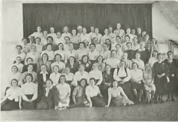
De „Zingende Moeders” der Nederlandse Zending.