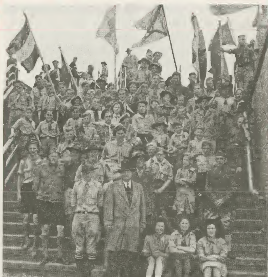
ONZE PADVINDERS TIJDENS DE ZENDINGSCONFERENTIE TE ROTTERDAM.