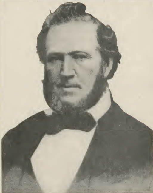
BRIGHAM YOUNG, „DE MAN VAN HET OGENBLIK”.