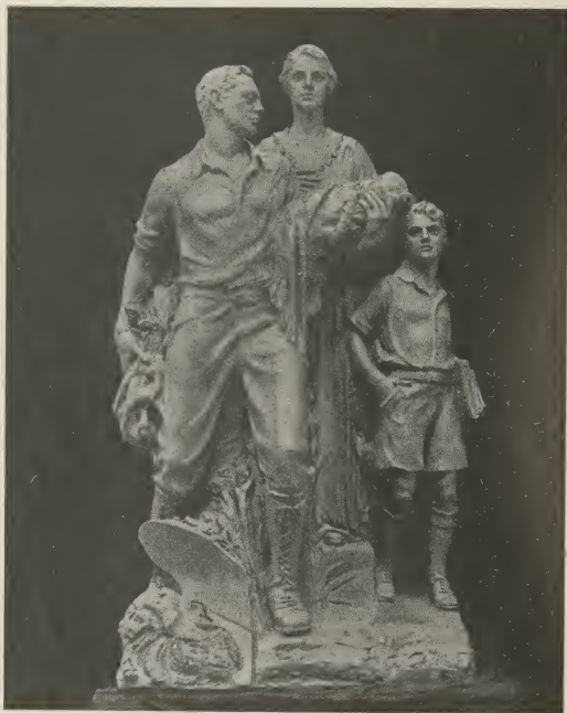
Hun doorzettingsvermogen schiep een nieuw Zion.