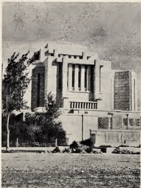
DE TEMPEL TE CARDSTON, CANADA, DIE 15 JAAR GELEDEN GEBOUWD WERD.