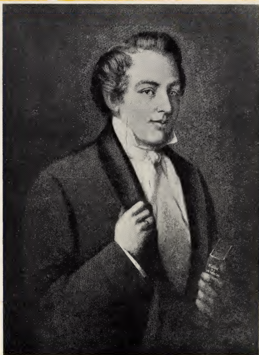
DE PROFEET JOSEPH SMITH OP 6 APRIL 1830 STICHTTE HIJ DE KERK.