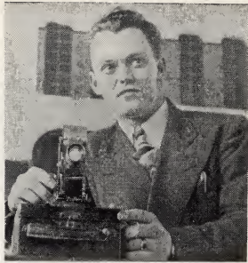
Het kleine projectie-apparaat dat een uitstekende zendeling blijkt te zijn.

Een ander waardevol hulpmiddel is de film, sinds enige tijd ook door de Kerk toegepast. De eerste stap in deze richting zijn de prachtige lichtbeeldenfilms, die sedert enige tijd ook in Nederland gebruikt worden, en door het kleine formaat van de projector buitengewoon geschikt zijn voor voorstellingen in besloten