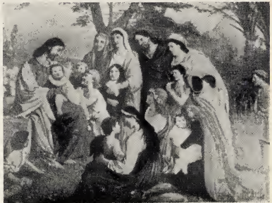
„Jezus en de kinderen”.

radio-comité der federatie heeft ons verzocht, ons radio-programma samen te stellen in de geest van Uw Richard L. Evans.” Gedurende het jaar 1947 is een zendelingenkoor, bekend als het Utah Eeuwfeest Koor, met enorm succes opgetreden in het oostelijk deel van de Verenigde Staten, in de steden, waar Joseph Smith eenmaal predikte. Welk een vreugde zou de profeet vervullen, als hij tot zijn geboortegrond terug kon keren en de verandering zag, die in de houding van het volk aan de dag treedt! Dit uit tien personen bestaande zendelingenkoor heeft zich zingend en sprekend een plaats veroverd in de harten van duizenden toehoorders. Het trad op in tientallen steden, voor clubs en scholen, en