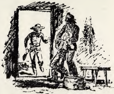
„Hier! Hier ben ik!" schreeuwde Dennis.

„Helaas voor jou niet," lachte Dennis. „Hij is niet zo dwaas die heksenbrouwsels te slikken. Nee, het is geen goed nieuws. Generaal Kearney heeft bevel gezonden, dat de troep binnen een week in Santa Fe moet zijn, anders worden we allemaal ontslagen. Luitenant Smith gaat met de beste mannen en dieren vooruit. Daarom verwisselde ik de ezels. Hannibal wil graag bij mij blij-