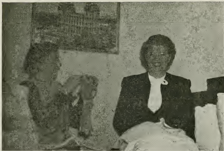
Is dit geen leuk pakje?