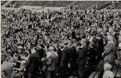
Een gedeelte der conferentiegangers in het Berlijnse Stadion.

zendelingen onderbreken hun reis te Goteborg om de taal en het Evangelie te bestuderen, voor zij uitgaan in de verschillende districten. Het gebouw doet dienst als hun school, terwijl het tevens het hoofdkwartier van het district is, en gebruikt wordt voor de bijeenkomsten der leden van Goteborg, welke gemeente een der grootste van Zweden is.