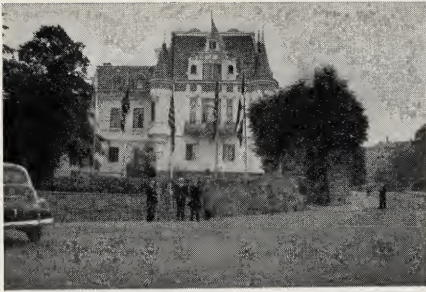
Het nieuwe vergadergebouw te Goteborg in Zweden.