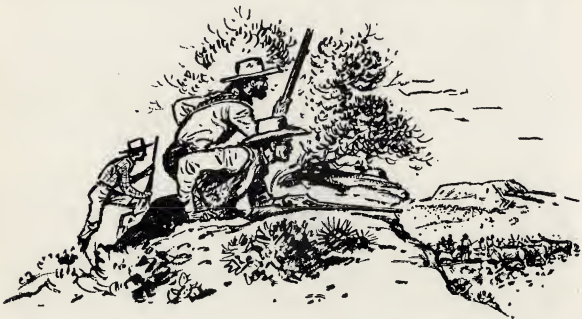
Toen zij een heuveltje beklommen hadden, zagen zij plotseling het Indianenkamp voor zich (Zie blz. 246)

Dennis maakte zijn ezels vast aan de paal terzijde van het huis en volgde de anderen naar binnen. Verwonderd liet hij zijn blikken gaan over de schone, geschilderde muren, de frisse witte gordijnen en de kleden op de vloer. In zijn gehele leven had hij niet zoiets hemels gezien, dacht hij. Hij had een gevoel alsof hij droomde. Plotseling kwam hij tot het besef dat het bijna een jaar geleden was, dat hij voor het laatst in een echt huis was geweest. Eerbiedig betastte hij de