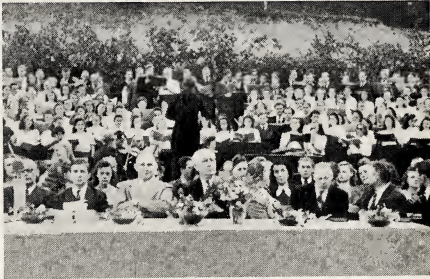
Kerkleiders op de Berlijnse Conferentie.

De conferentie, op grote schaal aangekondigd als de „Freud-Echo 1948“ (Vreugde-echo), werd gehouden in het Reichsportfeld, een groot openlucht stadion, dat door Hitler gebouwd werd,