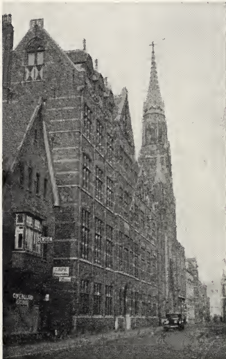
Het Rijksarchief te 's-Gravenhage