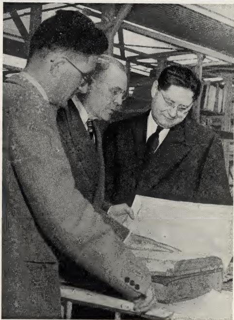
HISTORIE VOOR HET VOETLICHT. (Zie blz. 230)