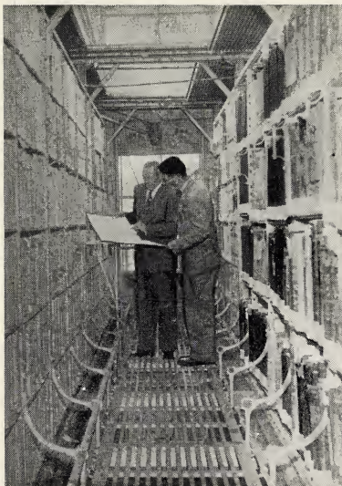
Oud. Archibald F. Bennett op de hoogste verdieping van het Rijksarchief te 's-Gravenhage.

December 1947 een aanvang maakt met microfilmwerk in het Rijksarchief te 's-Gravenhage. Op 1 Juli j.l. waren reeds meer dan een half miljoen bladzijden de lens gepasseerd. Op 31 Juli konden de volgende cijfers vermeld worden: