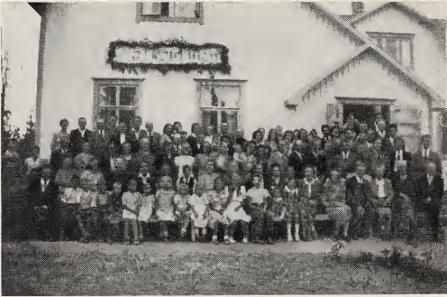
Finse leden voor het nieuwe kerkgebouw te Larsmo.

wij in Juli en Augustus onze reis door Europa voltooiden.