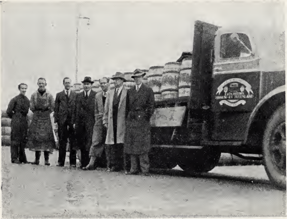
Zó werden de vaten naar de wagons gebracht.