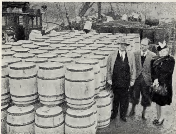
Tachtig vaten kostbare haring.