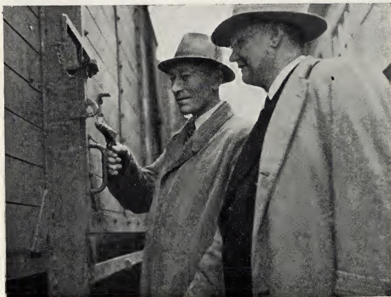
De laatste hand: het verzegelen der wagons. En nu . . .