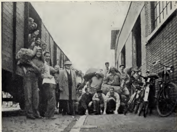
Zendingen van het Haagse en Rotterdamse district in actie. (Zeventig) ton aardappels laadden zij in de wagons!