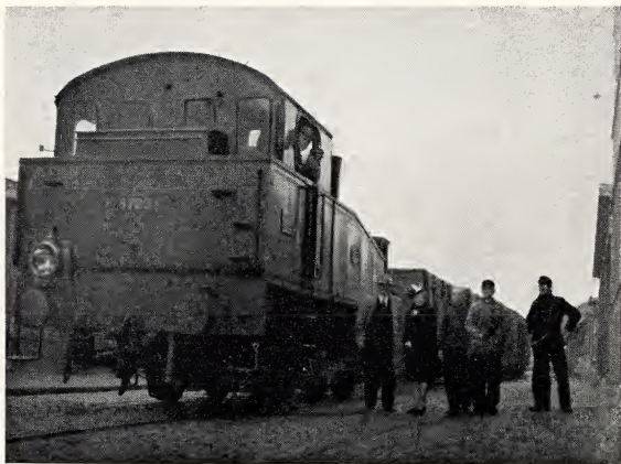
. . . klaar om te vertrekken. Goede reis en behouden aankomst!

Het is aan de gulheid en de geest van liefde van onze Hollandse Heiligen te danken, dat tachtig vaten kostelijke haring, product van Nederlandse vlijt, gezonden konden worden naar de leden der Kerk in Duitsland, waar ze met grote dankbaarheid ontvangen zullen worden.