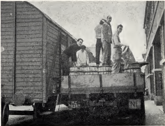
Hier worden de vaten overgeladen in de wagon, waarmede zij naar Duitsland werden gezonden.