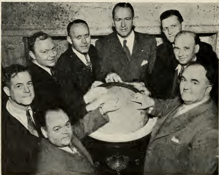
De voormalige Zendingspresidenten wijzen aan, over welke zending zij gepresideerd hebben.