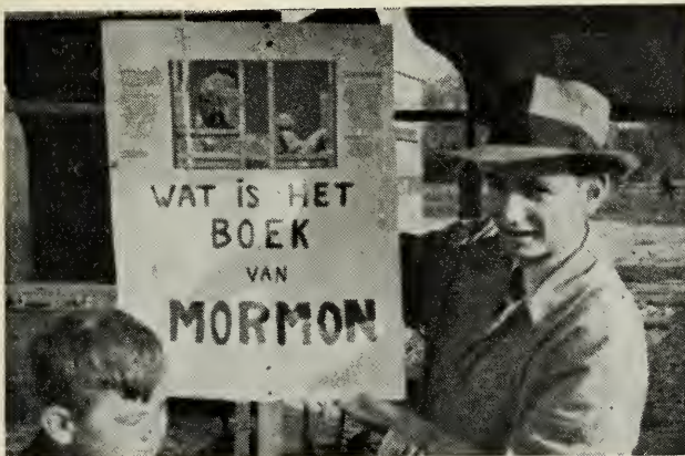
Immer bereid uitleg te geven.

Dag aan dag trekken duizenden jonge mannen en vrouwen de wereld in om met tractaten, veelal in gebrekkige taal — daar zij uitgezonden worden naar landen, waarvan zij de taal niet kennen — hun medemensen de vriendschap van leven en zaligheid te brengen.