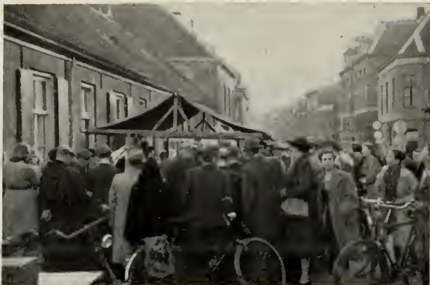
Vele belangstellenden rond de stand.

wegen om meer mensen te bereiken en zodoende meerderen in hun blijdschap te doen delen.