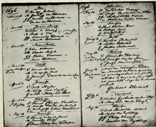
Een reproductie van een microfilm-opname.

Van hoeveel betekenis deze zendingen zijn voor de uit Zuid-Holland afkomstige, naar Amerika geëmigreerde leden, behoeft wel haast geen betoog. Zodra de films ontwikkeld zijn, zullen zij in de Genealogische Bibliotheek der Vereniging ter beschikking worden gesteld van allen, die bezig zijn hun geslacht uit te zoeken. Vele hindernissen zijn nu voor onze Hollandse leden in Amerika door de uitvinding van de microfilm weggelaten. Voorlopig althans wat betreft de mensen, wier geboorteplaats in Zuid-Holland is gelegen, want deze zijn nu niet langer afhankelijk van anderen om hun doden te redden!