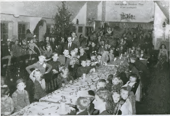
De jeugd genoot met volle teugen.

daad tot voorbeeld willen stellen. Zij laat ons zien wat er te bereiken is door het Jeugdwerk. Indien alle leidsters in de gehele Zending zoveel energie aan de dag legden als die van het Rotterdamse Jeugdwerk, zouden veel meer kinderen komen onder het gehoor van wat goed en mooi is. „Wie de jeugd heeft, heeft de toekomst”, is nog altijd een zeer waar woord. Wat men de kinde-