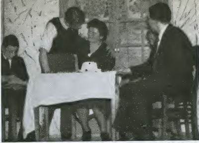
Scène uit: „A Christmas Carol.”