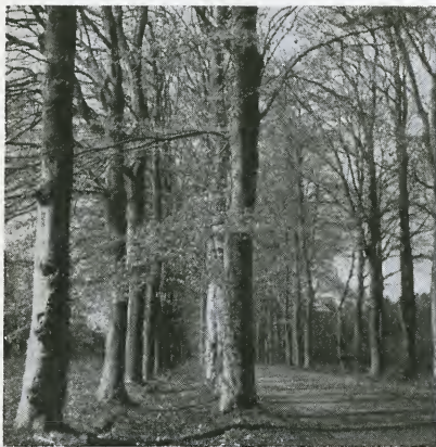
„Waar de stille heera”