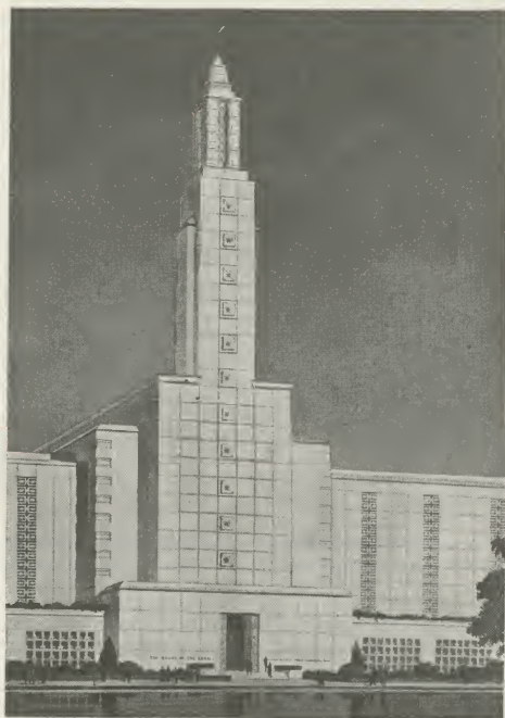
De Los Angeles Tempel van de Kerk van Jezus Christus.