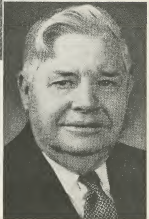
President J. Reuben Clark, 2e Raadgever.