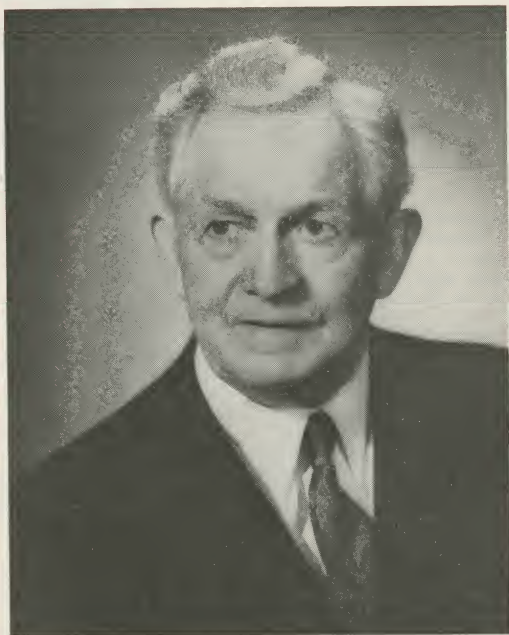
President David O. McKay