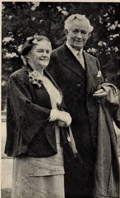
PRESIDENT DAVID O'MCKAY EN ZIJN ECHTGENOTE EMMA MCKAY TIJDENS HUN BEZOEK AAN NEDERLAND.