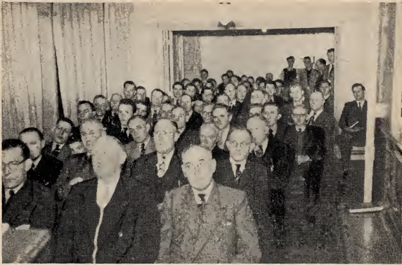
De priesterschap vergadering gehouden gedurende de conferentie van het District Rotterdam.