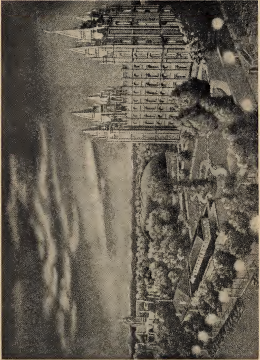
Het "Templeblock" te Salt Lake City, Utah.