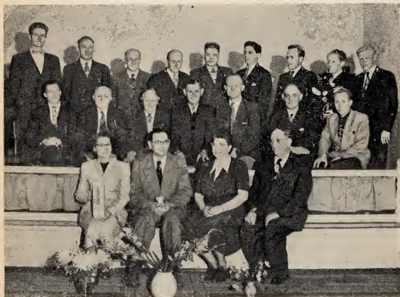
Bovenstaande photo's getuigen van de speciale vergaderingen die het Priesterschap en de Z.H.V. in Groningen hebben gehouden.