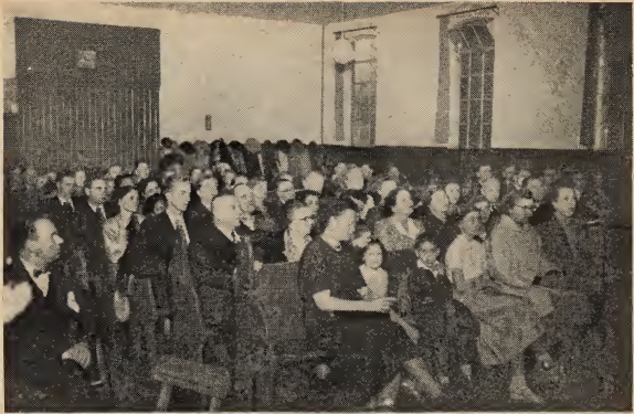
Utrechtse najaars-conferentie, gehouden te Hilversum.