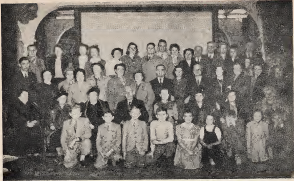
Leden van de Kerk in België.