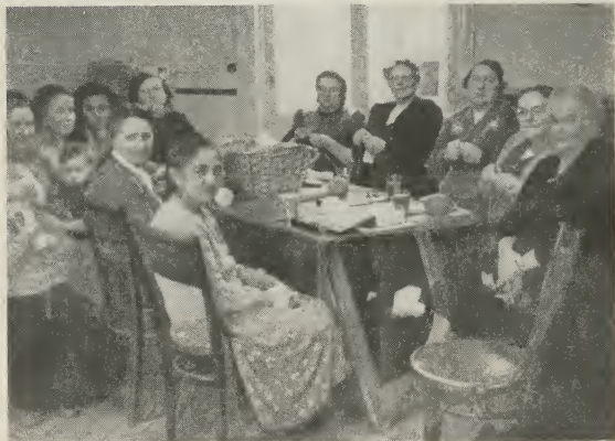
DE WERKZAME Z.H.V. VAN DEN HELDER.

bij onze Zusters-Hulpvereniging is een baak!