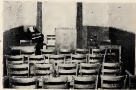
Het interieur van de vergaderzaal, vooraan gezien.