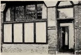
Filmopname van zeer nabij van de voorgevel van het gebouw.

leden van deze fijne gemeente veel succes en God's zegeningen in hun werk. Wij weten dat zij allen hun nieuwe vergaderplaats zullen waarderen en zullen streven om waardige voorbeelden te zijn voor hun vrienden zodat de gemeente mag groeien en voorspoed hebben onder hun leiderschap.