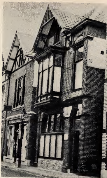
De voorgevel van de nieuwe vergaderplaats in Kinsbergenstraat 7, Apeldoorn.