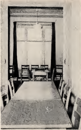
De suite is boven ten gebruike van de het Priesterschap, de Z.H.V., of als lokalen voor klaswerk.

kleine doorgang langs de zijkant van 't gebouw verleent er toegang toe. Niemand zal in het gebouw wonen, nochtans zullen de leden der gemeente voor het onderhoud verantwoordelijk gesteld worden.