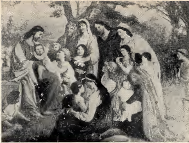
„Laat af van de kinderkens, en verhindert hen niet tot Mij te komen”