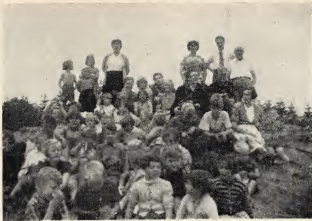
De Zondagsschool van Groningen tijdens haar uitstapje naar Zeegse, Drenthe