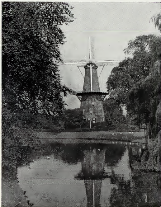
MOLEN TE LEIDEN