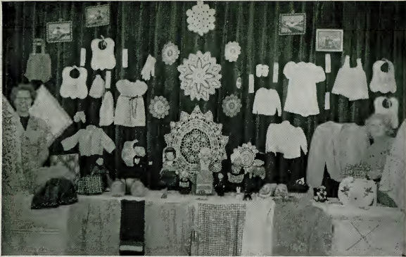
De verschillende Z.H.V. groepen in de Nederlandse Zending hebben ijverig gewerkt om de buitengewoon fraaie bazarartikelen te vervaardigen ten bate van de zendelingen en leden van onze zending en natuurlijk voor de Z.H.V. kas.