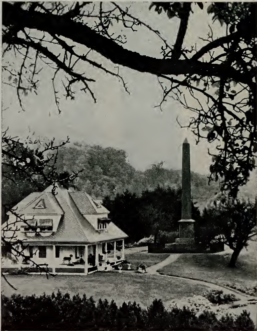
Geboortehuis van Joseph Smith