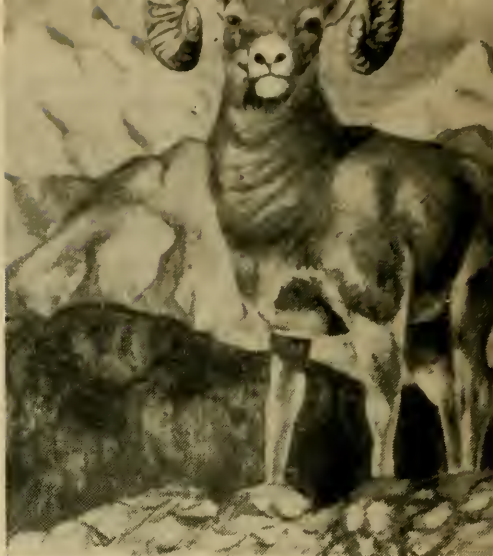
Het schaap van het Rotsgebergte.