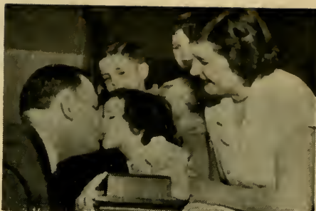
Wij moeten streven naar vrede en harmonie in het gezin. Indien wij niet in staat zijn getwist, gekibbel en zelfzucht buiten de deur te houden, hoe kunnen wij dan ooit hopen deze ondeugden uit de maatschappij te verbannen?

Onzedelijkheid en ongeloof zijn de twee voornaamste ondeugden, die de tegenwoordige beschaving dreigen te verzwakken en te ontwrichten. Helaas zijn de bezoeken van het moderne leven er op gericht het fundament van het Christelijk tehuis te ontbinden. Lichtvaardigheid op sexueel gebied onder jonge mensen, geboortebepierking en onmatigheid zijn verraderlijke en boosaardige vijanden van het gezin. Wanneer