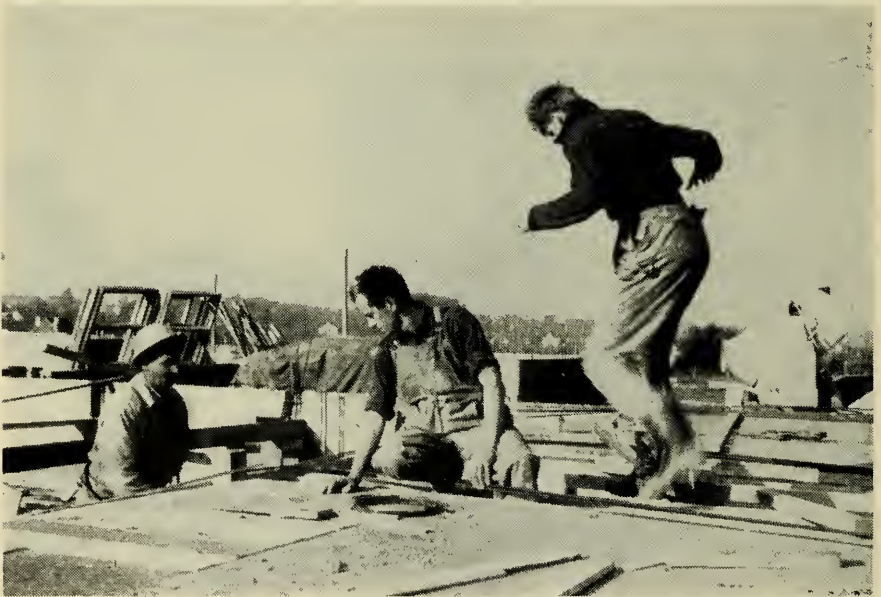
De supervisor is overal

Op de hoek van de Chaussee Romain en de Avenue de Bruxelles in de