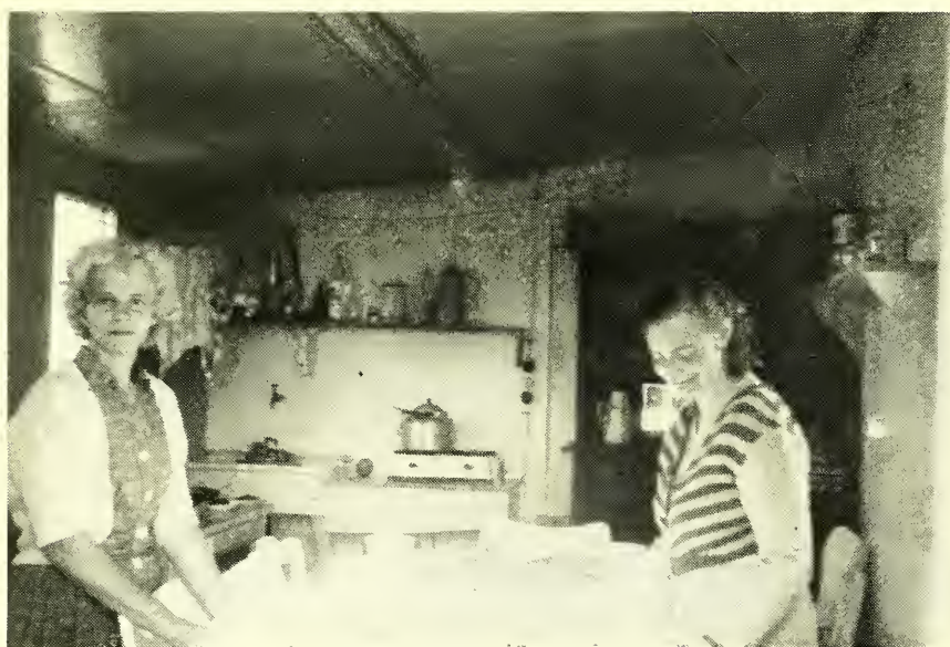
Zij zorgen voor de „inwendige” zending