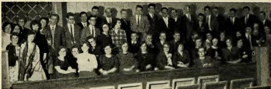
De deelnemers bij elkaar.