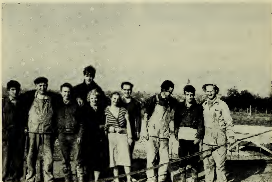
De hele ploeg

voorstad Strobeeck arbeiden een aantal mannen aan een bouwwerk, dat eveneens tot de Hemel zal reiken. En het merkwaardige is - hier komt het verschil met de bouwers in de laagvlakte van Sinear - zij spreken verschillende talen en toch verstaan zij elkaar zeer goed. Hoe is dit raadsel verklaarbaar? Daar in Brussel op de aangeduide plaats wordt door een groep leden van onze Kerk gewerkt aan de bouw van een Kerk voor de gemeente Brusel. Een kerk van Jezus Christus van de Heiligen der Laatste Dagen. En dat is toch beslist een bouwwerk dat ten Hemel reiken zal. Immers daar zal het hetstelde Evangelie worden verkondigd en dat Evangelie is de blijde boodschap voor ons allen om te kunnen terugkeren in de tegenwoordigheid van onze Hemelse Vader. De bouwers van Babel probeerden buiten God om de Hemel te bereiken, en waren dus als zij, van wie Jezus later verklaren zou: „Wie van elders inklimt is een dief en een moordenaar”. De bouwers in Stormbeek bouwen ter ere van God, de Vader en Zijn zoon en bereiken daarmee, dat velen de weg tot HEM zullen vinden . . . . Een hemelwaartse weg dus.