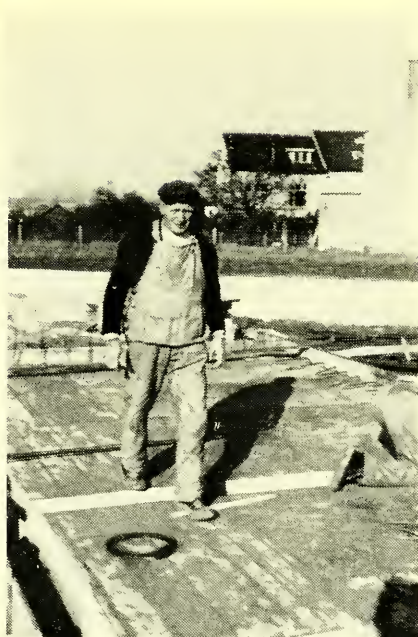
Een Poolse broeder