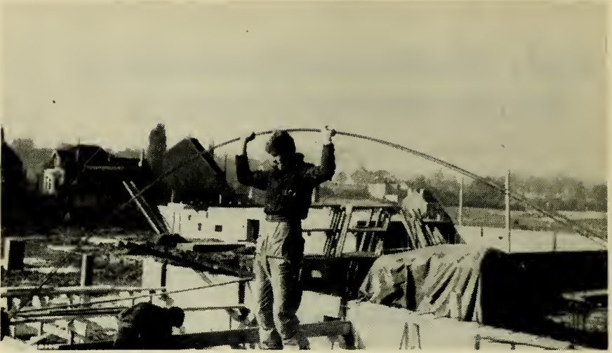
De boog is gespannen!

Want het is duidelijk dat wanneer men elkaars taal niet verstaat, het werk onuitvoerbaar wordt.