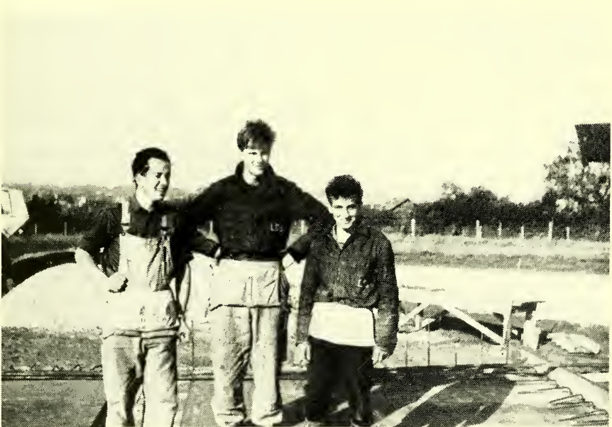
Het drietal uit „onze” Ring

Sindsdien is deze gebeurtenis in ons spraakgebruik opgenomen. Telkens wanneer wij een toestand aantreffen, waar de een langs de ander heen praat en men elk begrip dreigt te verliezen, spreken we van een „Babylonische spraakverwarring”.