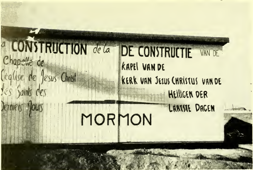
De voorbijganger verkeert niet in het onzekere

„Kunnen jullie elkaar verstaan?” is de eerste vraag, die opkomt als men al deze verschillende nationaliteiten ontdekt. Het antwoord laat niet lang op zich wachten. Behalve hun eigen nationale taal verstaan zij allemaal nog een taal en dat is de taal der liefde tot de arbeid in dienst van Hem, die ons roept tot een groot en wonderbaar werk. En die taal wordt nooit verward!! Elder Nyman geeft zijn instructies rustig, doelmatig en vervuld van de geest des Heren. En iedereen verstaat zijn taak. En het werk gaat vlot.